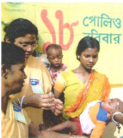
Sygeplejersker i arbejde

I år 2016 har det igen været muligt at støtte to projekter i Indien og i Uganda med penge fra jeres frimærker. Efterspørgslen efter nyere danske frimærker har vist sig at være større end vi har kunnet leve op til. Denne tendens er fortsat med større styrke ind i 2017. Det har medført at vi har måttet forhøje prisen lidt til vore aftagere, og denne stigning plus en pæn tilførsel af ældre frimærker, hvoraf nogen har været værdifulde, har givet os en nogenlunde konstant indtjening i forhold til i fjor. Hele beløbet, ialt 40.000 kr. har vi derfor kunnet sende videre til de to projekter vi plejer at støtte.